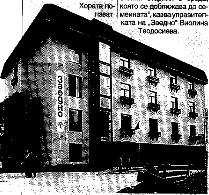
Домът за възрастни „Заедно“ в Симитли вече приема новите си обитатели. Те са настанени в условия като в четиризвезден хотел, но обстановката е близка до семейната среда. А медицинският екип е дежурен на поста си.